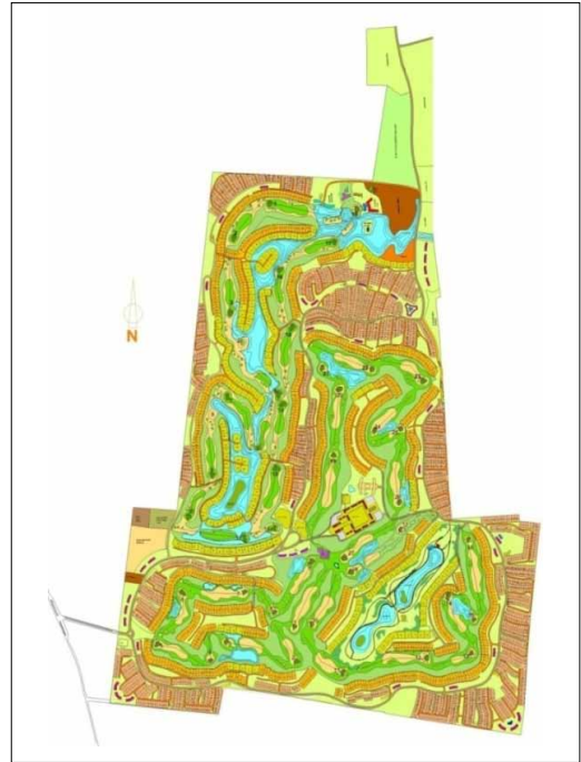
Figura 13. Plano original del proyecto Flamingo Lakes

Sin embargo las políticas y programas neoliberales que los gobiernos federales y estatales han implementado desde hace dos décadas, se han caracterizado por la falta de apoyo a las actividades productivas que realizan los campesinos y los habitantes del medio rural en México, así como por fomentar la dependencia de una sola actividad económica, el turismo. En el caso de Yucatán la falta de apoyo a industrias como la salinera y la henequenera han resultado en una alta migración hacia la capital del estado, el Caribe mexicano y Estados Unidos. Adicionalmente este tipo de políticas neoliberales consideran a la cultura y al patrimonio cultural de los habitantes de la nación como mercancías, susceptibles de venderse en los mercados globales mediante un mal entendido “turismo cultural” que solo beneficia a compañías trasnacionales y a grupos de poder nacionales e internacionales (Franco, 2005, 2011). Otorgando permisos a industrias trasnacionales para el usufructo y la explotación comercial de lugares patrimoniales 17 sin importar el deterioro de estos y del ambiente natural en el que se encuentran, el gobierno federal viola la Ley Federal sobre Monumentos y Zonas Arqueológicas, Artísticas e Históricas, los acuerdos internacionales firmados por México para la protección del patrimonio (Díaz Berrio, 1975) y los principios con los que fue creado el INAH según los cuales el patrimonio cultural es de todos los mexicanos y es un instrumento para la educación (Franco, 2011).