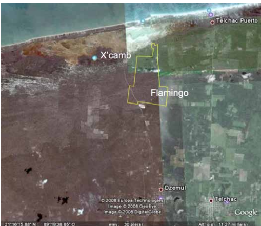
Figura 7. Imagen de satélite de la región de Xcambó y del predio que ocupará FlamingoLakes, junto con las poblaciones de Dzemul y Telchac Puerto.

Los antiguos sistemas de conocimiento desarrollados en la región de Xcambó, que hacían posible