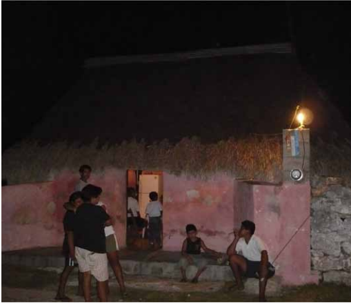
Figura 10. Casa maya tradicional en Dzemul.