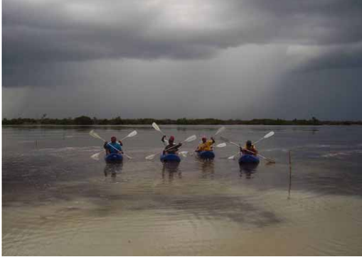
Figura 15. Miembros de la cooperativa Saya Chaltun en la Laguna Rosada