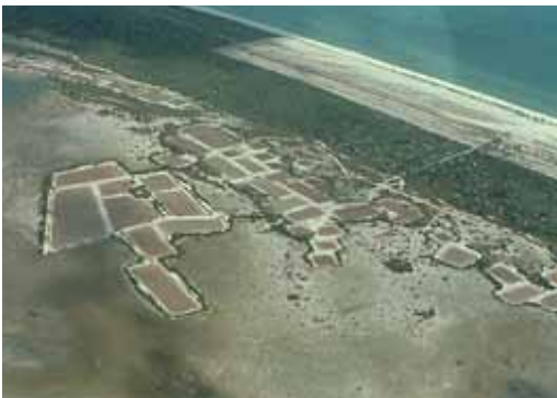
Figura 9. Las salinas de Xtampú.

Los ejidatarios que comenzaron a trabajar en el lugar durante la primera mitad del siglo XX relatan el uso de técnicas de cosecha y almacenamiento de sal que, de acuerdo a las investigaciones arqueológicas y etnohistóricas se usaban durante la época prehispánica y el período colonial 10 . La actividad salinera ha estado vinculada desde la época prehispánica con otras actividades que se continúan realizando en la región de Xcambó, como el aprovechamiento forestal. En las sabanas, selvas y petenes que rodean al sitio arqueológico, así como