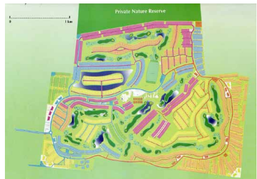
Figura 14. Desarrollo urbano aceptado por Semarnat.

Esta legislación responde a la vulnerabilidad de la hidrología costera, pues los estudios muestran el peligro de perforar 25 hectáreas de lagos artificiales y cimientos para 2,397 residencias y 21 edificios para condominios, destruyendo la coraza calcárea superficial –el tzekel – cuyo espesor máximo es 1.5 m y cuya función es mantener un equilibrio entre las presiones de los mantos acuíferos subterráneos y superficiales para evitar la mezcla de las capas de agua salada con las de agua dulce. Es muy probable que su destrucción lleve a la salinización de las reservas de agua