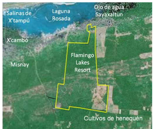
Figura 8. La región de Xcambó y el lugar donde se construye Flamingo Lakes, mostrando las áreas donde se realizan las actividades mencionadas en el texto.