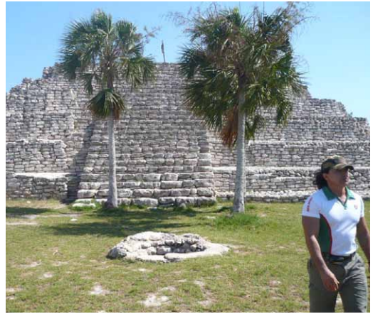
Figura 6. Plaza principal de Xcambó.