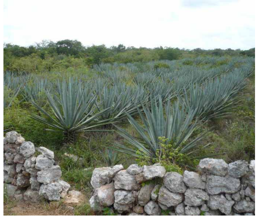
Figura 11. Plantel de henequén en Dzemul.

En la Península de Yucatán los conocimientos necesarios para la realización de la agricultura de milpa se encuentran codificados en la cultura maya actual, en la que han ido amalgamándose y