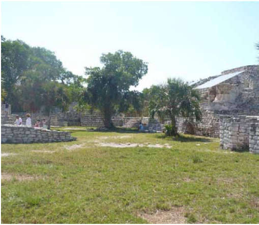
Figura 5. El sitio arqueológico de Xcambó.