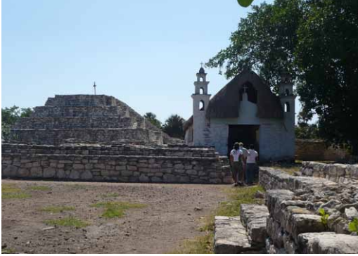
Figura 12. La capilla de la Virgen de Xcambó y el Cerro de la Virgen.