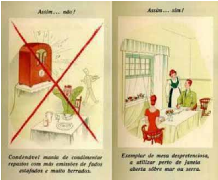
Imagem 2. Cartilha da Hospedagem Portuguesa: adágios novos para servirem a toda a hospedaria que não quizer perder a freguesia