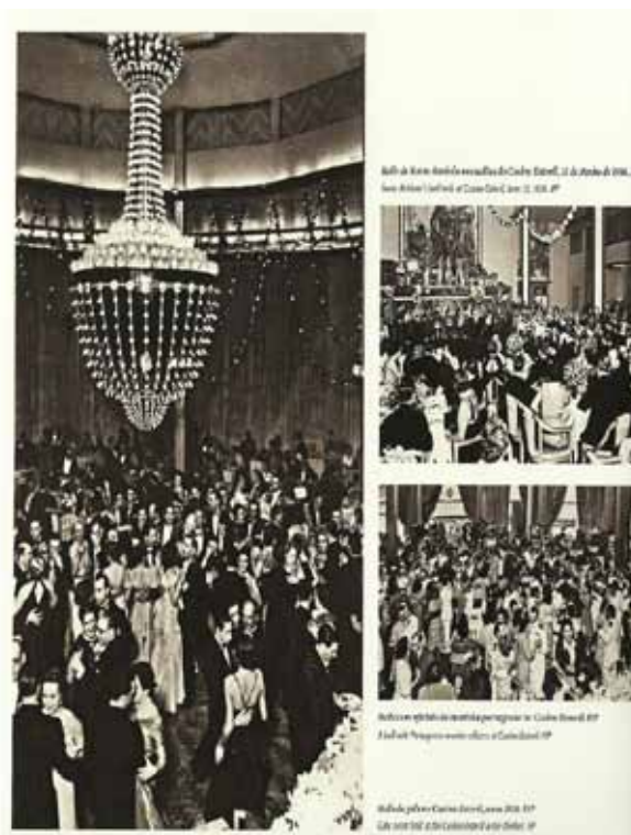
Imagem 4. Os Estoris nos Anos Trinta