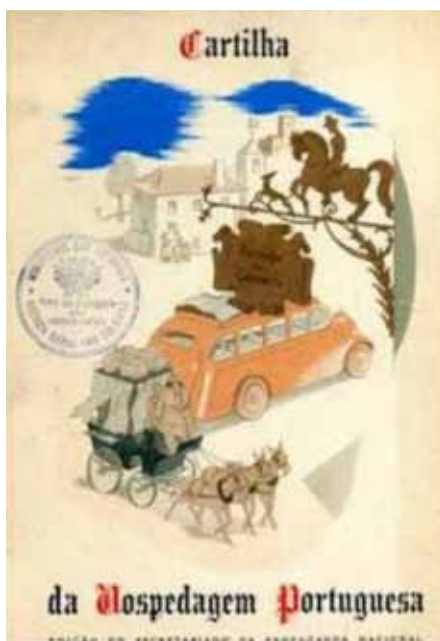
Imagem 1. Cartilha da Hospedagem Portuguesa: adágios novos para servirem a toda a hospedaria que não quizer perder a freguesia

Fonte: Pinto, Augusto, 1941. Cartilha da hospedagem [...]. Lisboa: Secretariado Nacional da Propaganda.