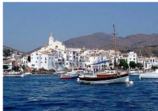
Foto 1. Cadaqués, Costa Brava.

La primera colonización turística de España se produce en el litoral mediterráneo y las islas: la Costa de Levante, con centros tan emblemáticos de esta mezcla de arena y cemento como Benidorm; la Costa del Sol; Mallorca (antes que Ibiza y Menorca), las Islas Canarias (sobre todo el sur-oeste de Tenerife y Gran Canaria), y, en Cataluña, la Costa Brava, primero, y la Costa Dorada, después, ambas con emplazamientos tan representativos de este tipo de turismo como Lloret i Salou, respectivamente. Es el turismo de sol y playa, denominado también de las tres eses: Sun, Sea, Sand (sol, mar y arena), a las cuales se suele asociar una cuarta: Sex (sexo), e incluso, a veces, una quinta: Sangría , que vendría a aludir a lo que la consellera de la Generalitat Montserrat Tura llamó turismo de borrachera , y que tantos quebraderos de cabeza y mala imagen han comportado. El caso es que un clima, unas playas y unos parajes privilegiados, la edificación en primera línea de mar, y un importante diferencial en cuanto al poder adquisitivo, convierten la costa mediterránea española, y también, pues, la catalana, en un destino próximo y extremadamente atractivo para las clases medias y populares de los países europeos más desarrollados.