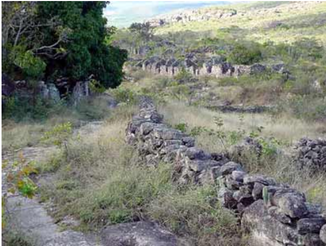
Figura 8: Ruínas do bairro Luís dos Santos.

Nessa época no Luís dos Santos tinha mais de mil pessoas. Lá tinha vendada, tinha tudo! Fazia festa muito micareme 12 e bonito. Na festa de lá tinha tanta moça que fazia micareme lá e que batia no micareme da praça. Era separado por política, o pessoal daqui da praça fazia um cordão e pegava campanha com o do Luís dos Santos.