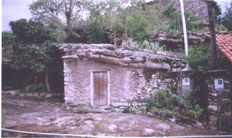
Figura 5: Toca de garimpeiro.

depois do campo de futebol, tudo cheio de gente. Tinha casas atravessando o rio, até em cima do João Batista. Subindo a cachoeira, as ruínas que se vê, tudo era cheio de gente. Até perto dos córregos dos pombos.