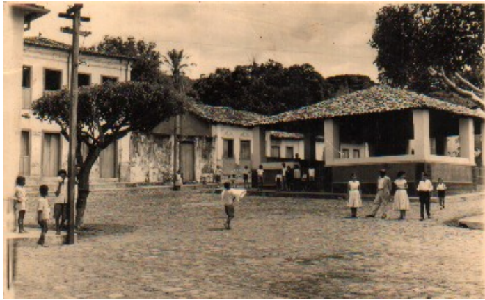
Figura 6: O mercado municipal na década de 1950.

vida e, indiretamente a de toda a comunidade. Nessa época, quem não trabalhava diretamente com o garimpo, precisava dele para sustentar seu comércio. Era de onde vinha o dinheiro, muito dinheiro