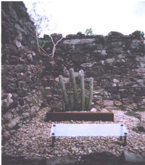
Figura 4: Xique-Xique ( Pilosocereus gounellei ) na galeria Arte & Memória.

A identidade fala mais alto, como quem ainda resiste às mudanças traçadas pelo tempo. Ser de Xique-Xique é ter suas lembranças preservadas, é ser fiel a sua memória, ao seu chão. É pertencer, ser daqui e não de outro lugar, é ser raiz junto com o lugar. Bolle (1984: 14) reduz que a "[...]