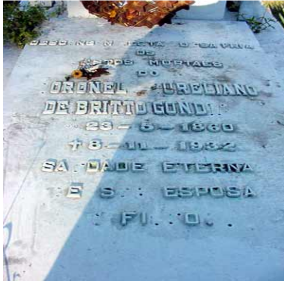
Figura 3: Túmulo do Cel. Aureliano de Britto Gondin.

A vila resiste. Xique-Xique de Andaraí ou simplesmente, Xique-Xique como ainda