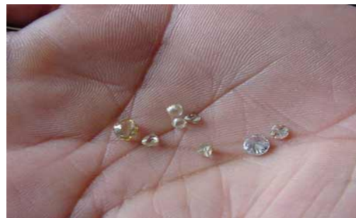
Figura 10: Diamantes na mão de um comprador.

O garimpo constituiu-se como a principal atividade econômica da região durante décadas. Traçou a história política, econômica e toda a estrutura social narrada na memória e registrada na paisagem do lugar. Como toda atividade produtiva, o garimpo deixou marcas no cenário local que, sob uma ótica cultural, faz a leitura de um passado que não parece muito distante. Ainda hoje muitos moradores estão à procura do diamante perdido, aquele que realizaria o sonho de riqueza.