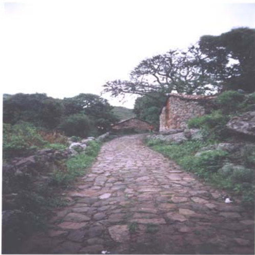
Figura 2. Entrada da vila.

Antes da abolição da escravatura, com a sanção da Lei Áurea em 13 de maio de 1888, os escravos foram responsáveis pelas