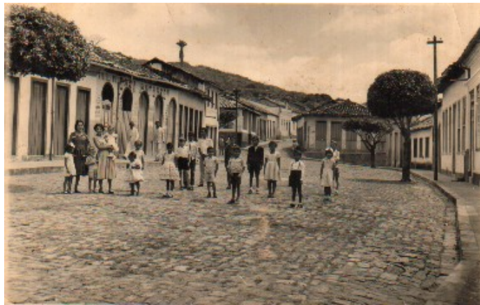
Figura 7: O centro da vila em meados de 1960.

ficaram desocupadas viraram territórios de escavação, que viam assoalhos sendo destruídos por picaretas que ainda acalentavam sonhos. Salas, quartos, casas inteiras transformadas em garimpo, sucumbindo-se ao desespero ou a ambição de quem ainda estava por lá. Estarrecido Seu O.B.L. de 82 anos rememora: “[...] o garimpo era farto todo mundo era garimpeiro, tinha umas três mil pessoas aqui em Igatu, mas ao romper dos tempos, o tempo vai lhe mu-